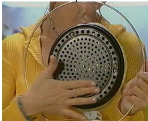
Capital Beauté ©Thomas Barbey

première partie : Capital Beauté , Thomas Barbey, 1 min. 28 – 2000 Ring , Jérôme Gras, 2 min. – 2002 Tango , Franck et Olivier Turpin, 5 min. 10 – 1996 Georges Perec seul dans sa piaule , Loïc Connanski, 2 min. 40 – 1991 Heat (knowing your appliance) , Terrence Handscomb, 5 min.27 –2000 ©opyright (mise en vente) , Raphaël Boccanfuso, 1 min. 30 – 2007